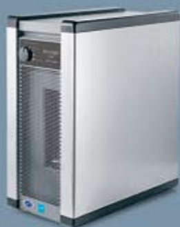
Beyond Guardian Air El único purificador con tecnología ActivePure ®